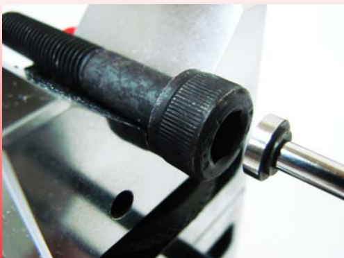
螺絲頭部厚度量測