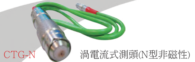
CTG-N 渦電流式測頭(N型非磁性) 測定對象：非磁性金屬上的非導電絕緣鍍層