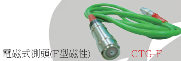
電磁式測頭(F型磁性) CTG-F 測定對象：磁性金屬上的非磁性鍍層