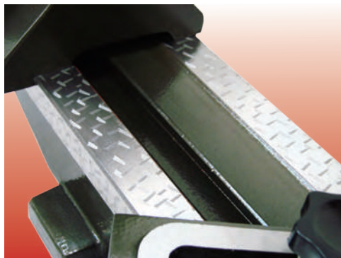
精密研磨鑄花基座