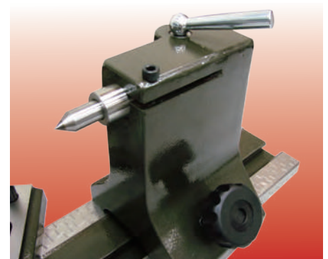
活動頂心同心滑座